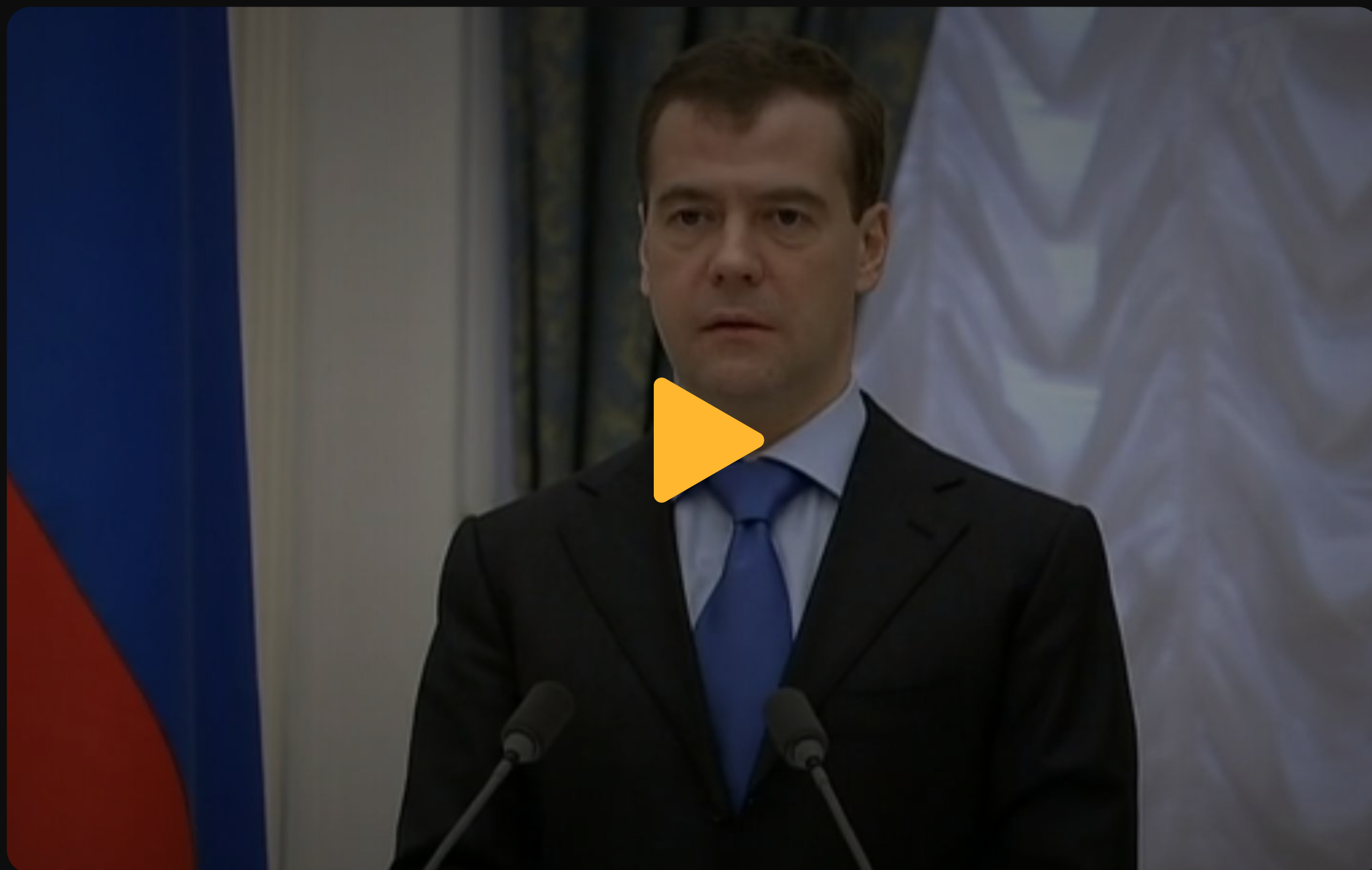
Президент вручил в Кремле государственные награды группе военнослужащих внутренних войск МВД России